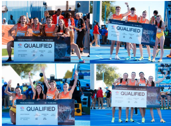
Els 4 equips classificats per Pequín 2027