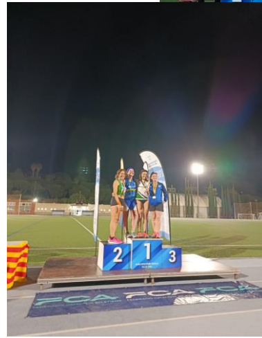
Les 4 màsters que van prendre part dels 10000