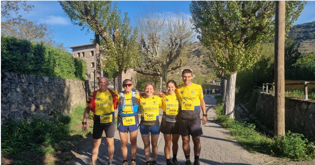
Alguns dels nostres participants pel trail berguedà