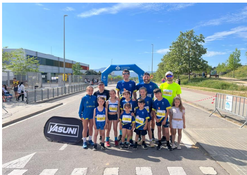
L'àmplia representació canovellina a Colors