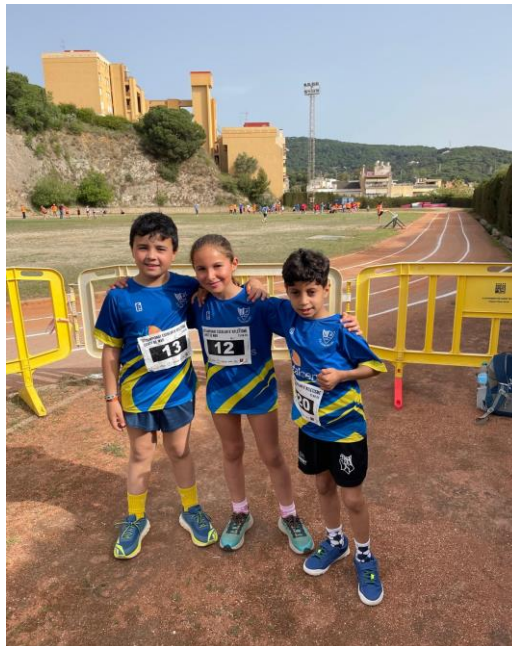
3 dels nostres a Canet

Una jornada que, tot i no ser en una pista homologada, va servir per a que alguns dels nostres atletes s'estrenessin en algunes modalitats atlètiques no practicades fins al moment.